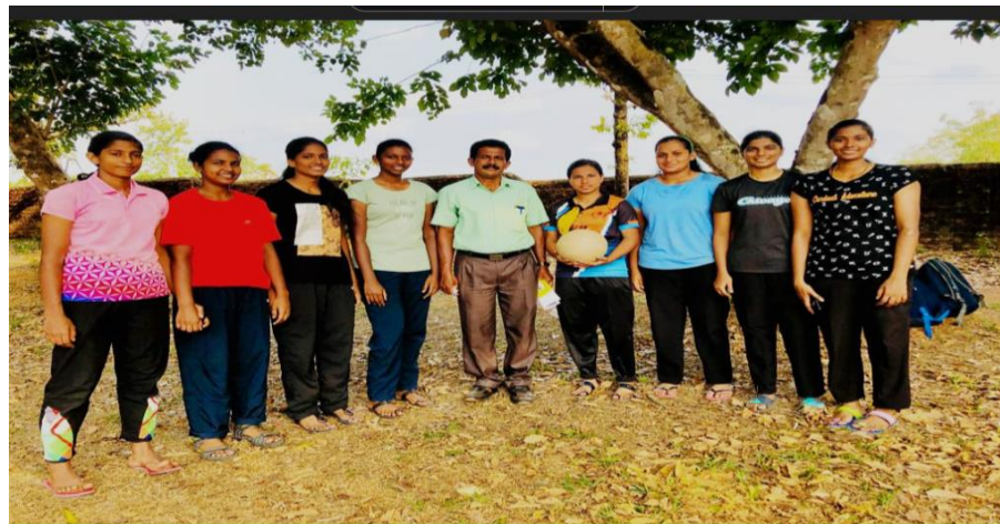
NETBALL TEAM- RUNNERS UP