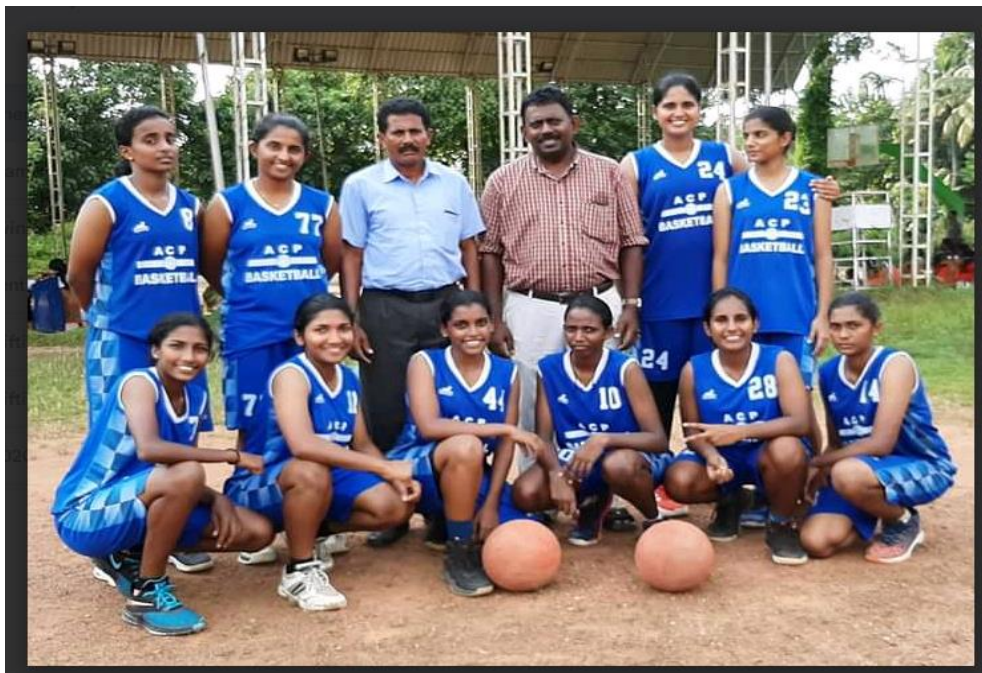
College Basketball team- M.G university - runners up 2019-20