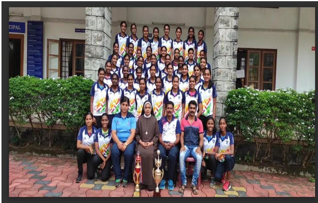
COLLEGE ATHLETIC TEAM