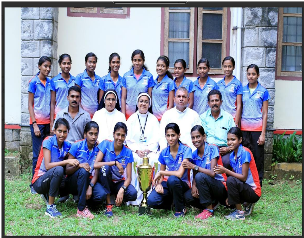
CROSS COUNTRY M.G UNIVERSITY winners 2019 -20