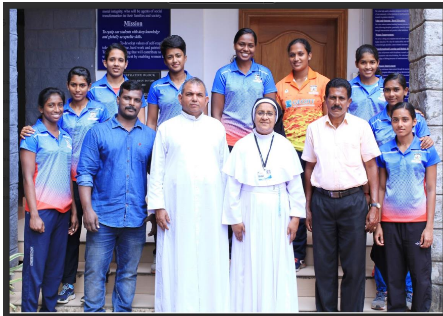
MG University intercollegiate weight lifting and powerlifting Winners