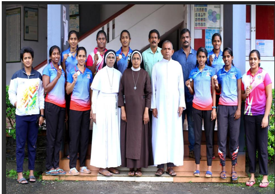
WEIGHT LIFTING AND POWERLIFTING TEAM