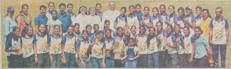
ജില്ലാ അത്ലറ്റിക് ചാമ്പ്യൻഷിപ്പിൽ സീനിയർ വിഭാഗം ഓരോർ ചാമ്പ്യനായ പാലാ അൽഫോൻസാ കോളേജ് റം - അരുൺ 85%