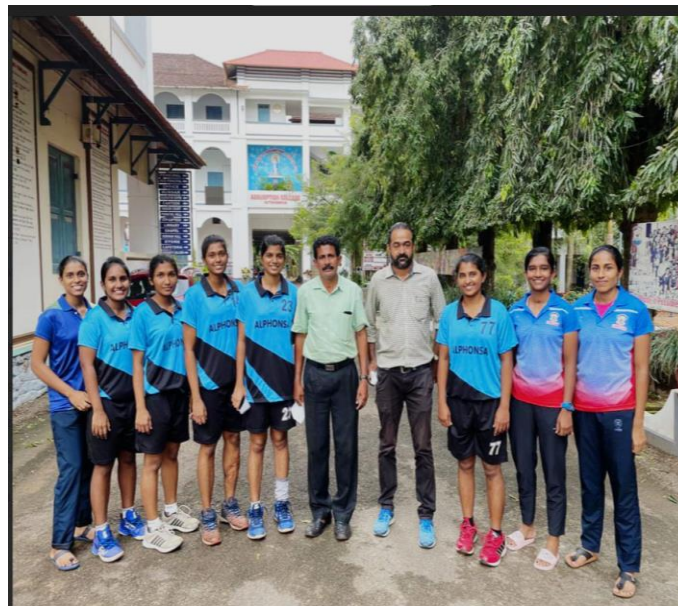
M.G UNIVERSITY - BASKETBALL RUNNERS UP