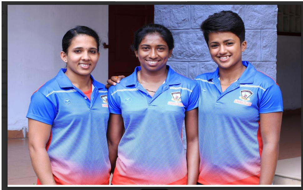
MG University intercollegiate weight lifting and powerlifting first position holders