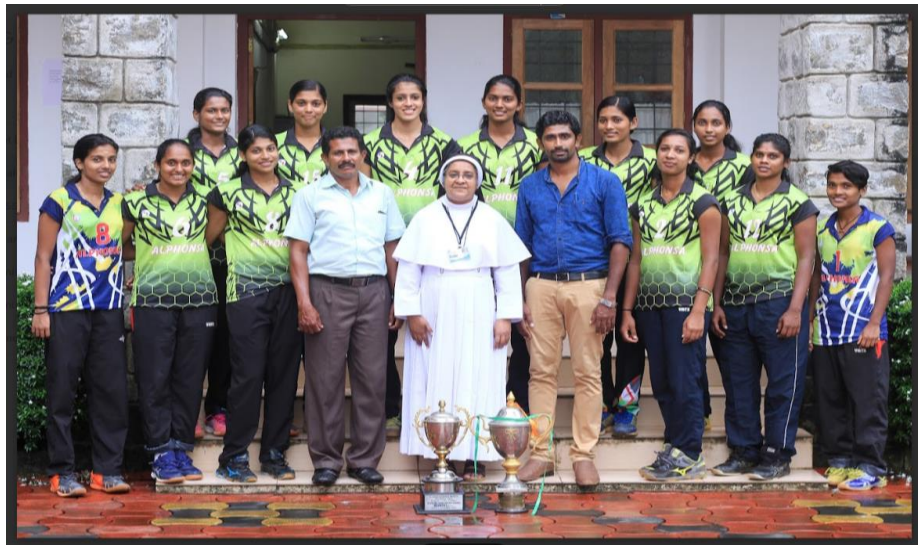
All Kerala intercollegiate volley ball championship winners (S. H COLLEGE THEVARA - Bertholomia trophy winners) 2019 -20