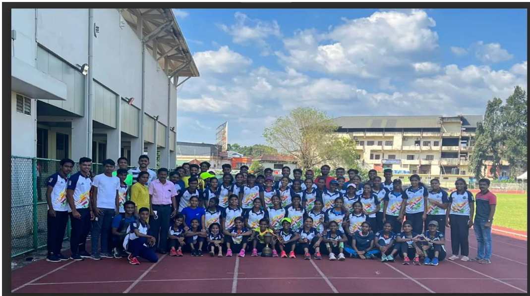
ALPHONSIAN SPORTS ACADEMY TEAM